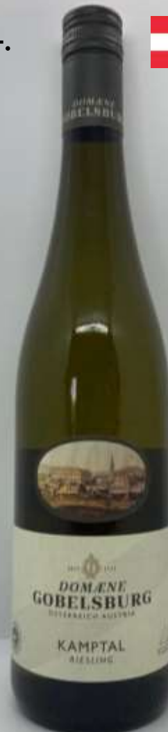
14. Domaene Gobelburg, Riesling