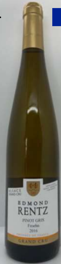
16. Domaine Edmond Rentz, Pinot Gris, Froehn Grand Cru