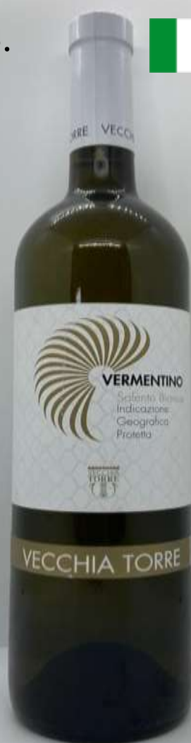
13. Vecchia Torre, Vermentino