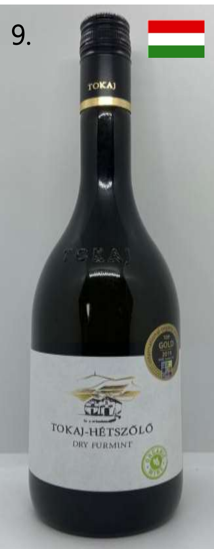
9. Tokaj-Hétszölő, Dry Furmint