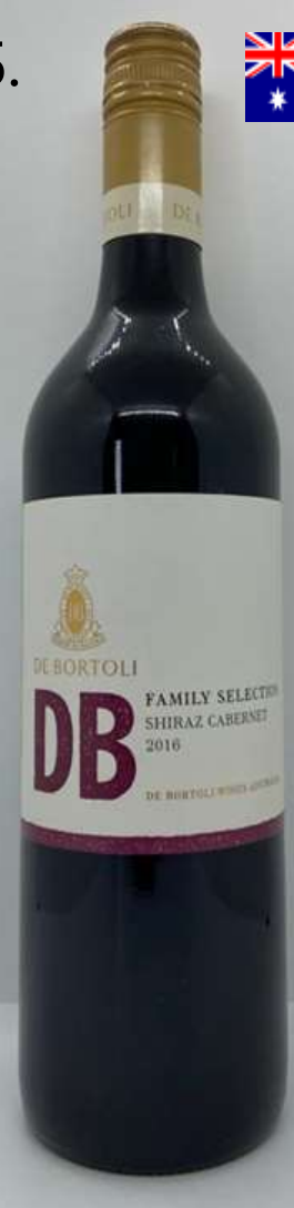
25. De Bortoli DB Range, Shiraz