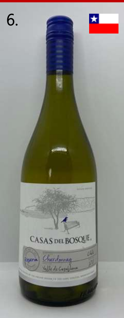
6. Casas del Bosque, Chardonnay