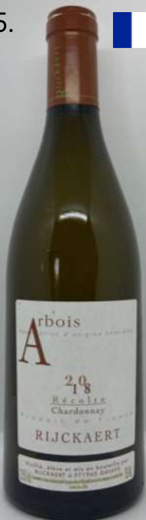
15. Domaine Jean Rijckaert, Chardonnay