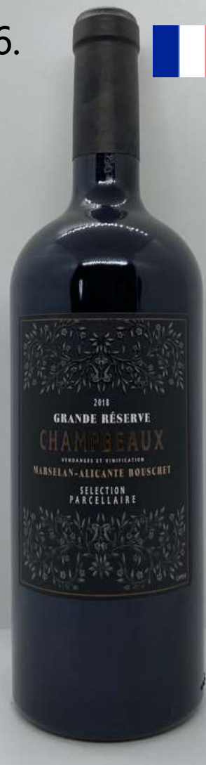
26. Champbeaux, Grande Réserve