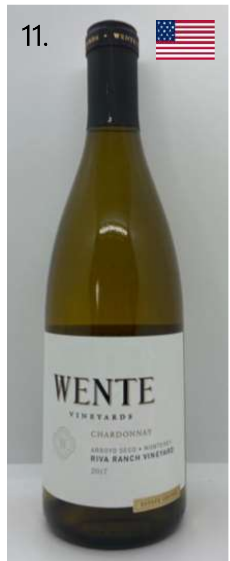
11. Wente, Livermore Valley, Chardonnay