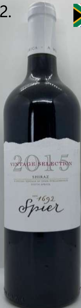
22. Spier, Vintage Selection, Shiraz