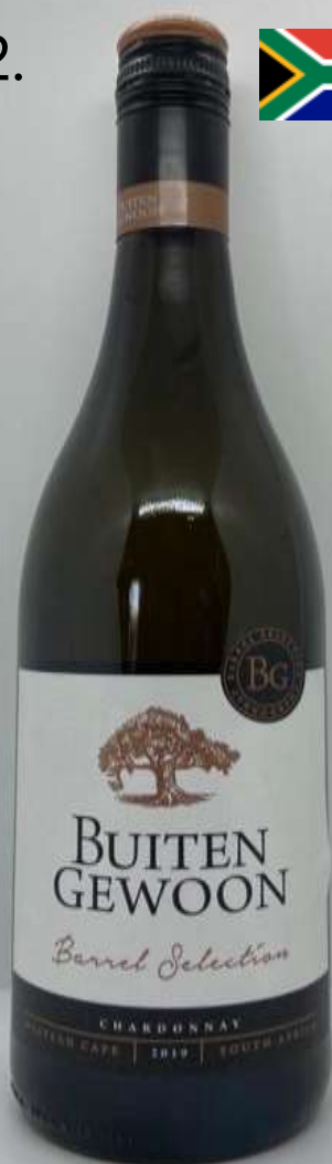
12. Buitengewoon, Chardonnay