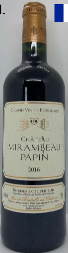
21. Château Mirambeau Papin