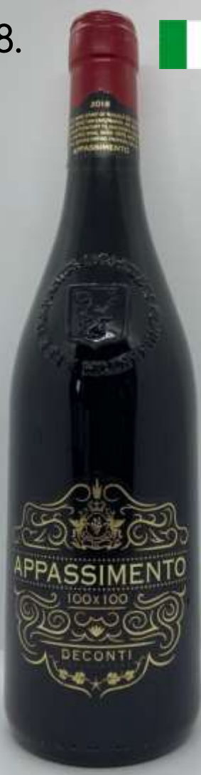
28. De'Conti 100x100 Appassimento