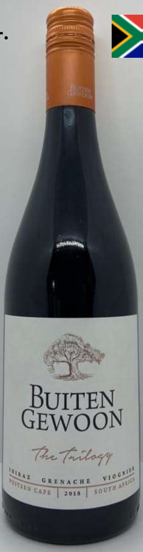
24. Buitengewoon, The Trilogy