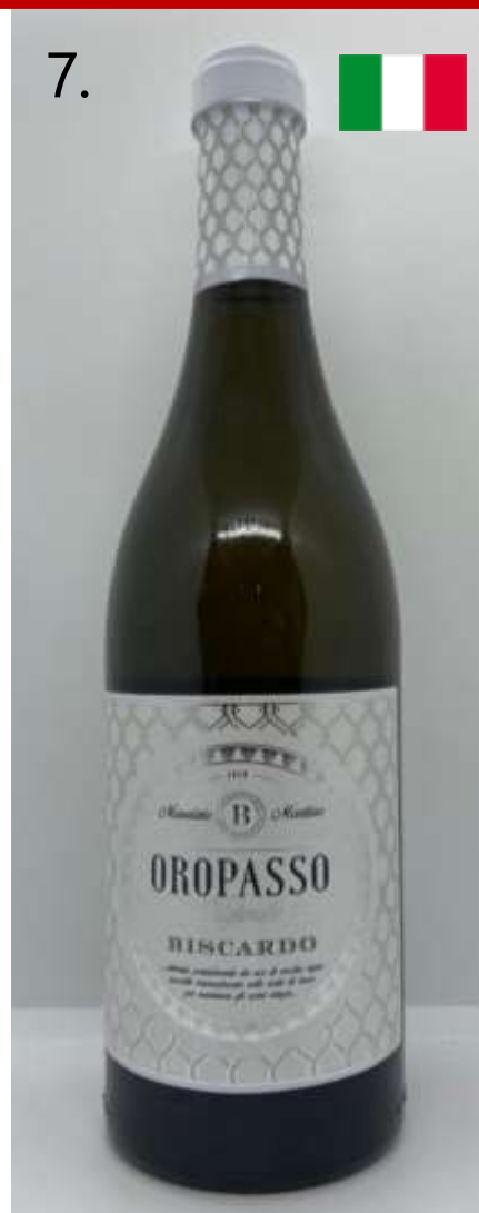
7. Cantina Mabis, Oropasso