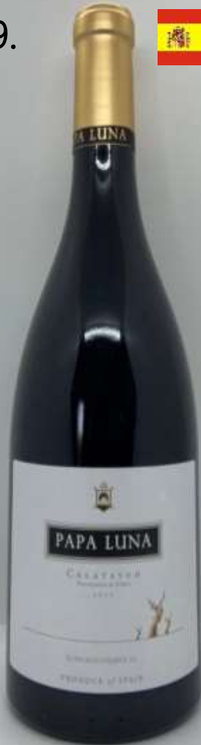
19. Papa Luna