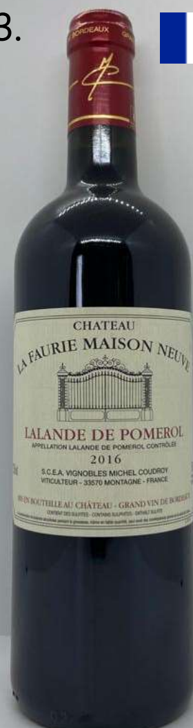
23. Château La Faurie Maison Neuve