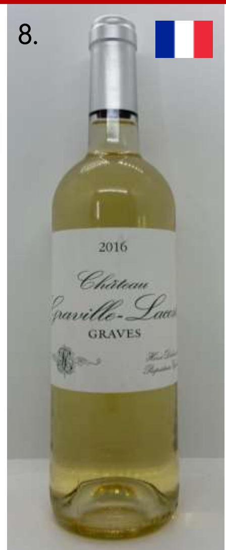
8. Château Gravelle-Lacoste, Graves Blanc