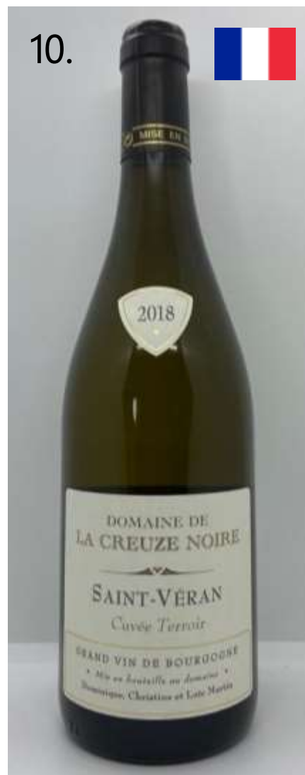
10. Domaine de la Creuze Noire, Saint-Véran