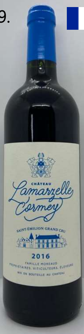
29. Château Lamarzelle Cormey