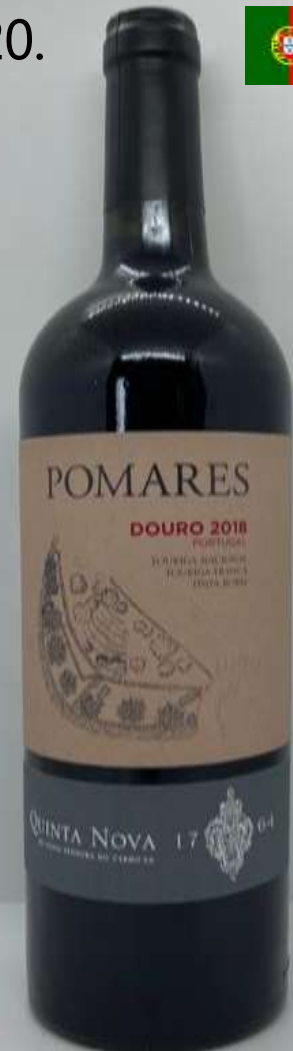
20. Quinta Nova, Pomares, Tinto