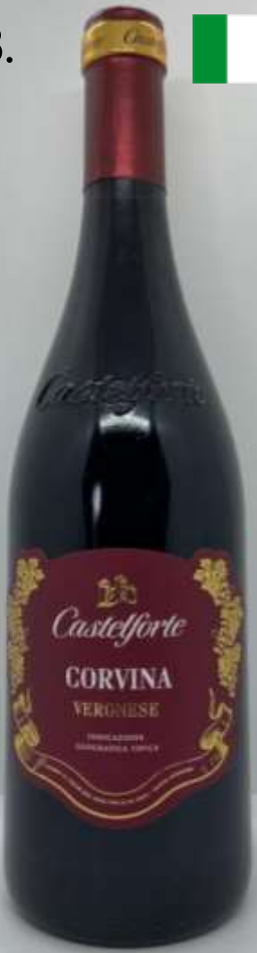
18. Castelforte Corvina